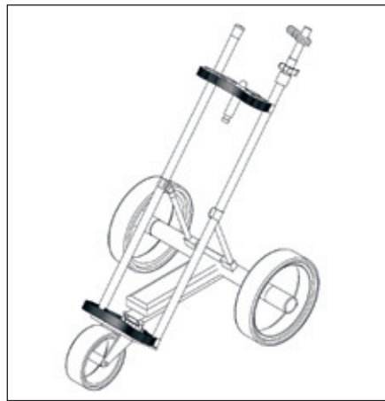
Zeichnung zum Gemeinschaftsgeschmacksmuster