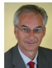
Dipl.-Ing (TU), ist Geschäftsführender Gesellschafter bei der InvenComm GmbH